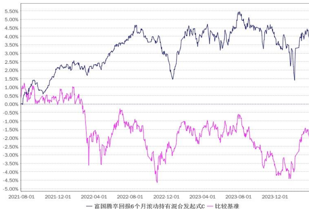
净值增长率与业绩比较基准收益率的历史走势对比图